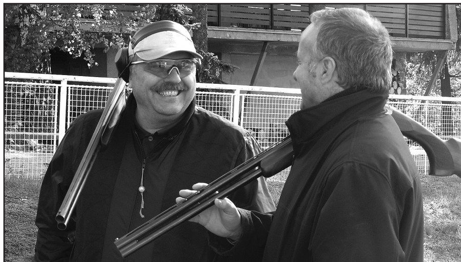
Foto: Při střeleckých závodech v Brně